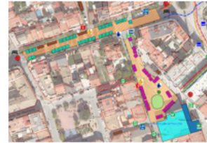
Plànol de distribució de les parades (Exemple)